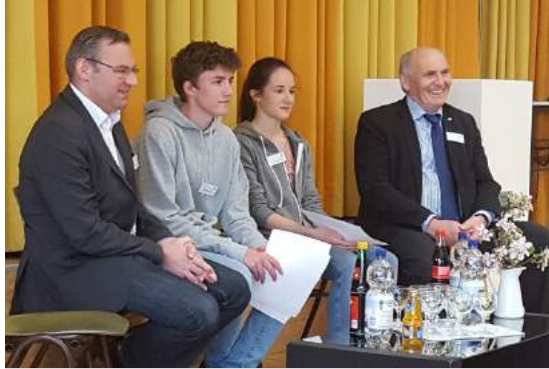
Unser ehemaliger Schüler, MdE Norbert Lins, und MdB Waldemar Westermayer bei einer Diskussion mit unseren Schülern in der Aula anlässlich des Europa-Projekttag 2017.

In Informationstechnik erlernen die Schüler in Klasse 7 grundlegende Arbeitstechniken mit dem PC. Im Methodentraining werden in Klasse 7 und 8 Arbeits- und Präsentationstechniken systematisch erlernt, die über die reine PC-Anwendung hinausgehen: Ein Thema gliedern, recherchieren, bearbeiten, schriftlich ausarbeiten und präsentieren wird hier anhand fächerübergreifender Themen aus dem Bildungsplan gelernt und geübt.