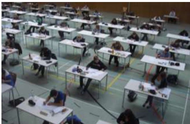
Abschlussprüfung in der Riedhalle

Französisch (startet nun schon in Kl. 6 und kann ggf. wieder abgewählt werden) Technik Alltagskultur, Ernährung und Soziales