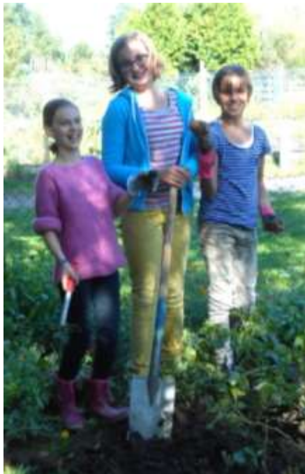
Damals wie heute beliebt: Der Schulgarten.

Das Wort real stammt vom lateinischen res (=Sache) und bedeutet auf die Wirklichkeit bezogen . Die erste Realschulklasse in Wilhelmsdorf