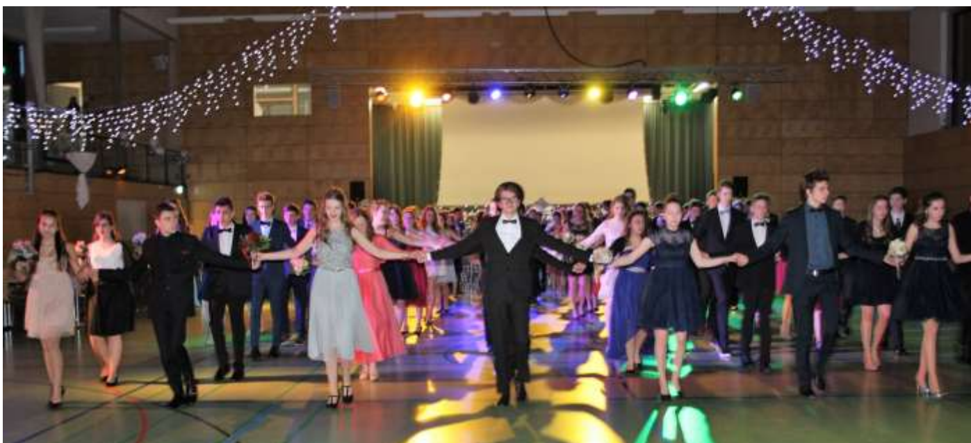
Großer Auftritt: Abschlussball des Tanzkurses der 9. Klassen des Bildungszentrums Wilhelmsdorf in der festlich geschmückten Riedhalle.