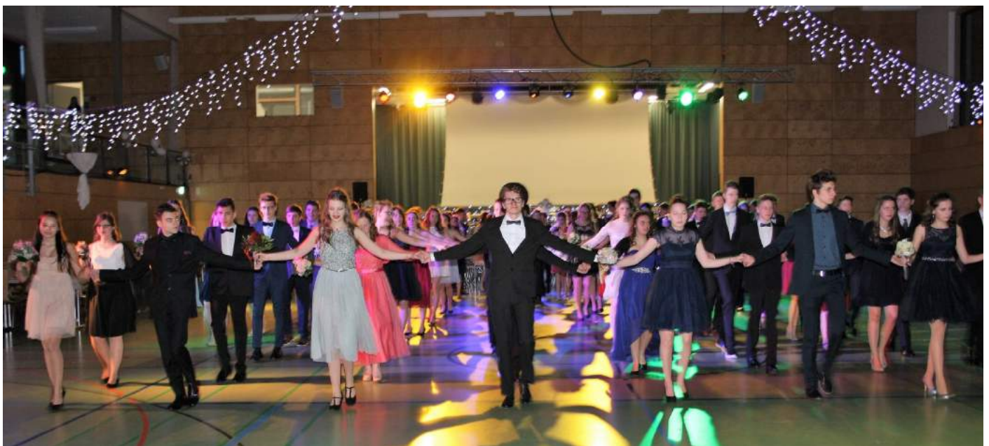
Großer Auftritt: Abschlussball des Tanzkurses der 9. Klassen des Bildungszentrums Wilhelmsdorf in der festlich geschmückten Riedhalle.