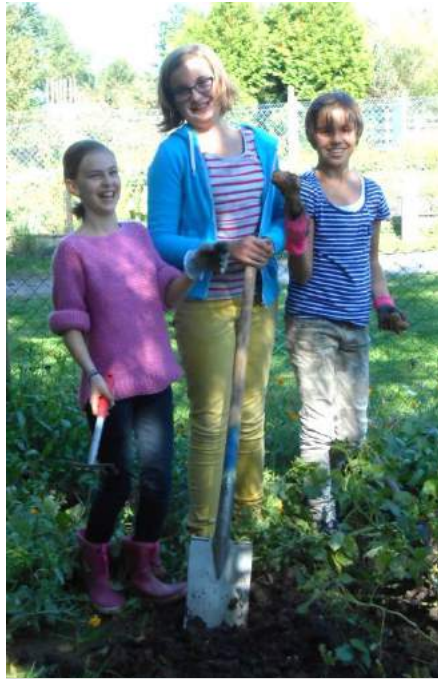
Damals wie heute beliebt: Der Schulgarten.

Alltagsferne und knochentrockene Lateinschulen – sie waren der Auslöser, vor 250 Jahren in Preußen die ersten Realschulen zu gründen, die sich an den Realitäten des Alltags und den Bedürfnissen der Schüler orientieren sollten. Die Schulen erhielten einen Schulgarten, die Lehrerausbildung wurde reformiert und dem Abitur gleichgestellte Bildungsabschlüsse eingeführt.