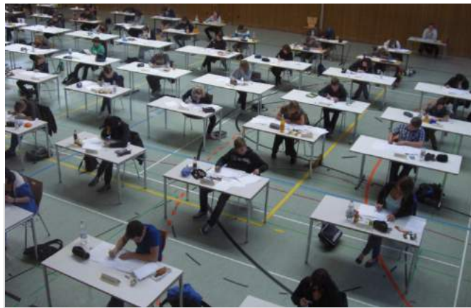
Abschlussprüfung in der Riedhalle

Französisch (startet nun schon in Kl. 6 und kann ggf. wieder abgewählt werden) Technik Alltagskultur, Ernährung und Soziales